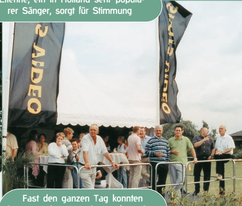
Fast den ganzen Tag konnten die Gäste der Party die vorbeiziehenden Läufer beobachten