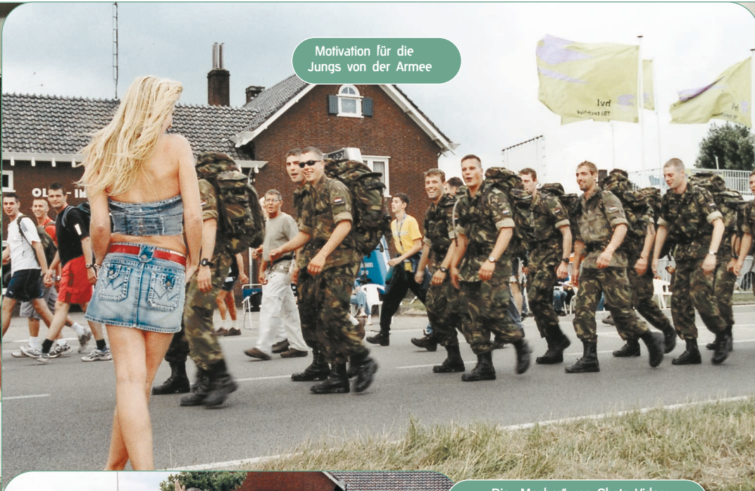
Motivation für die Jungs von der Armee