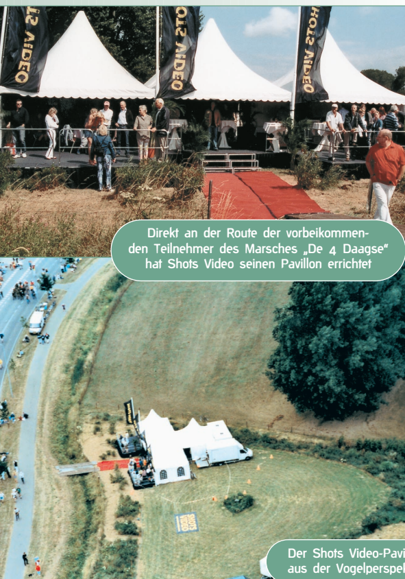
Direkt an der Route der vorbeikommenden Teilnehmer des Marsches „De 4 Daagse“ hat Shots Video seinen Pavillon errichtet