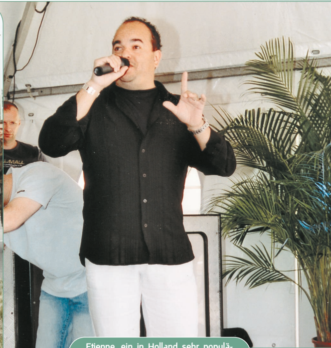
Etienne, ein in Holland sehr populärer Sänger, sorgt für Stimmung