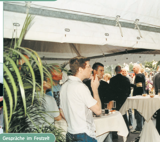
Gespräche im Festzelt