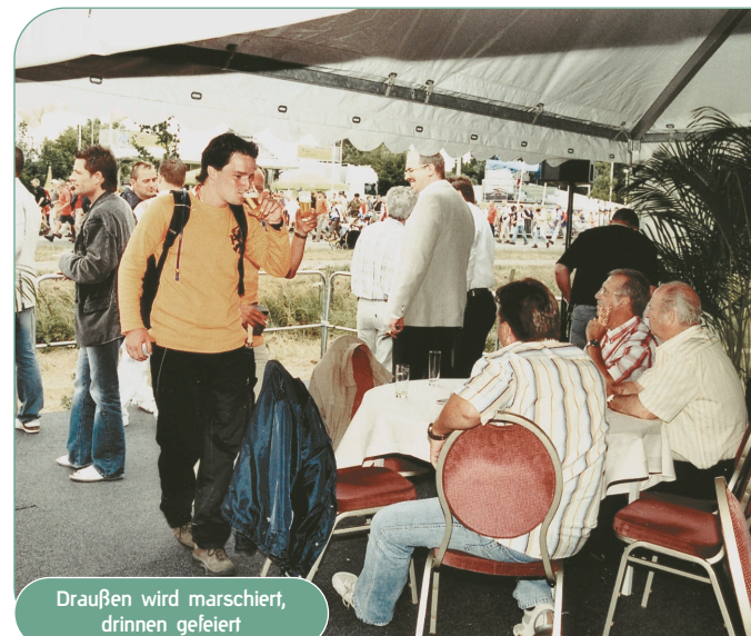
Draußen wird marschiert, drinnen gefeiert