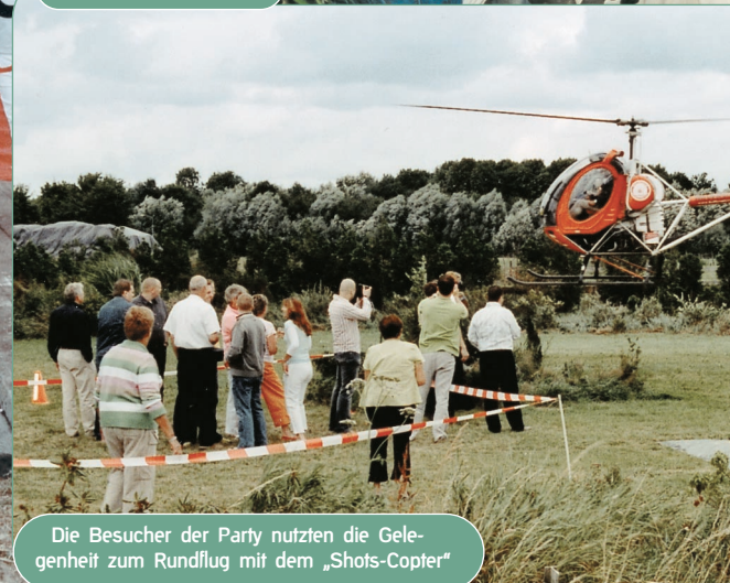
Die Besucher der Party nutzten die Gelegenheit zum Rundflug mit dem „Shots-Copter“