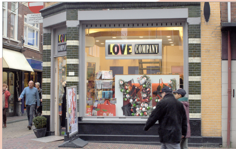
Love Company - Ein modernes und frauenfreundliches Geschäft in Purmerend, nahe Amsterdam Fortsetzung von Seite 78