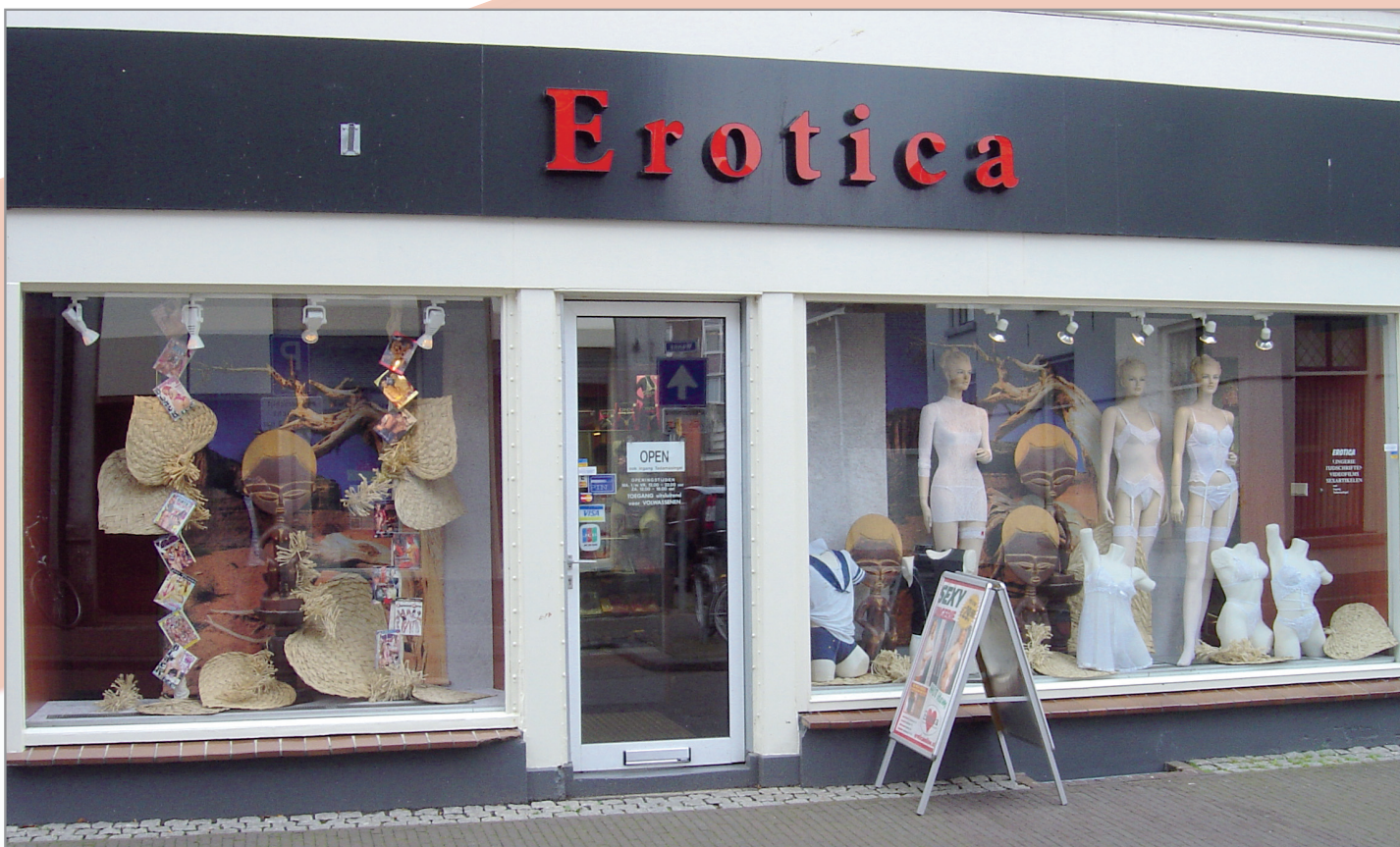
300 bis 350 Erotikgeschäfte zählt der holländische Markt, hier ein Bild des Geschäfts Erotica in Zutphen